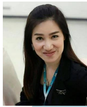
บัวหลวง ถิ่นแก้ว

คณะกรรมการสภากรรณออมทรัพย์ เครือโรงพยาบาลพญาไทและเปาโล จำกัด